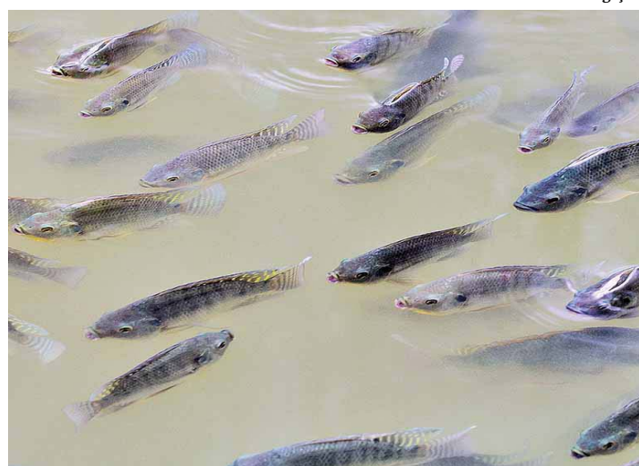
Medida deve gerar emprego e renda

O presidente Jair Bolsonaro editou nesta segunda-feira (14) um decreto que torna as regras para a cessão de espaços físicos em corpos d'água de domínio da União para a prática da aquicultura mais alinhado à realidade da aquicultura brasileira, desburocratiza o processo e aprimora os mecanismos de gestão da ocupação e