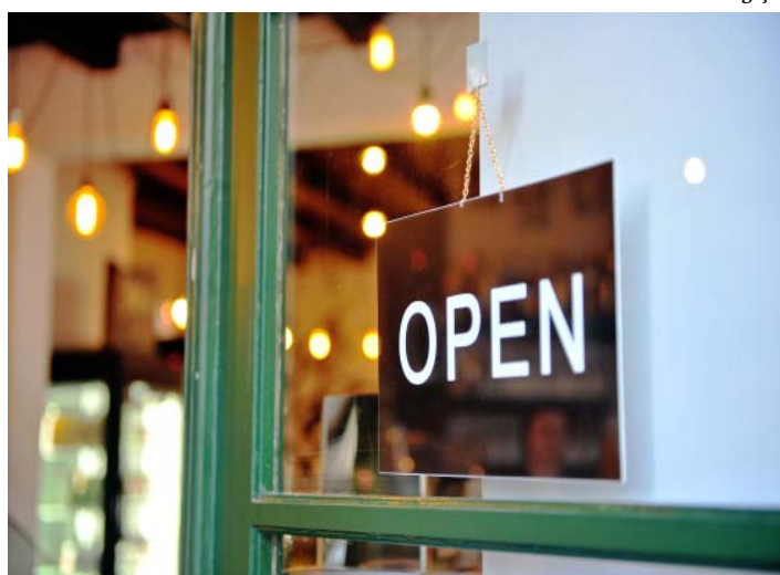
Há 19,7 milhões de empresas ativas no país

Mais de 40% das empresas abertas em novembro conseguiram o registro em menos de 24 horas. Esse é um dos principais dados da atualização de novembro do Mapa de Empresas, ferramenta virtual disponibilizada gratuitamente ao público pelo Ministério da Economia. Conforme os dados, o último mês se encerrou com 19.744.641