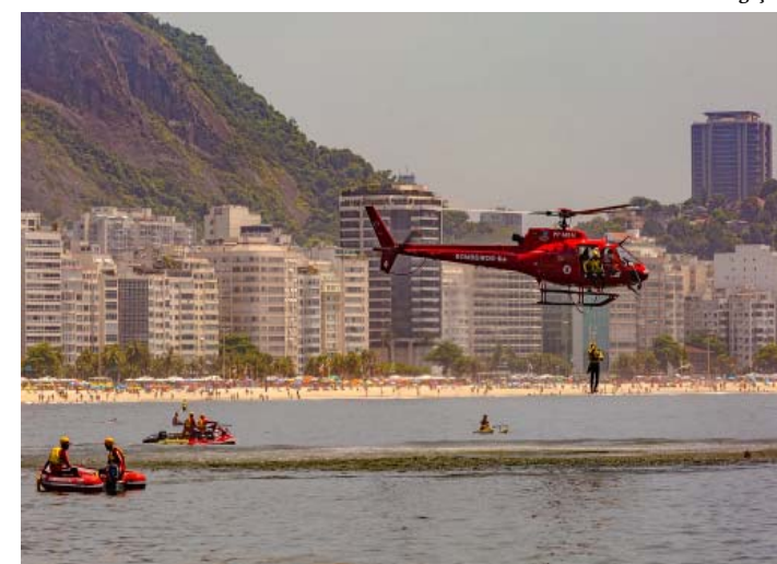
Operação segue até março

A Operação Verão 2021 do Corpo de Bombeiros Militar do Estado do Rio de Janeiro (CBMERJ) começou, nesta segunda-feira (21), com reforço de efetivo e de equipamentos para garantir a segurança dos banhistas. Cerca de 1,2 mil guarda-vidas da corporação vão monitorar as praias do Estado com o