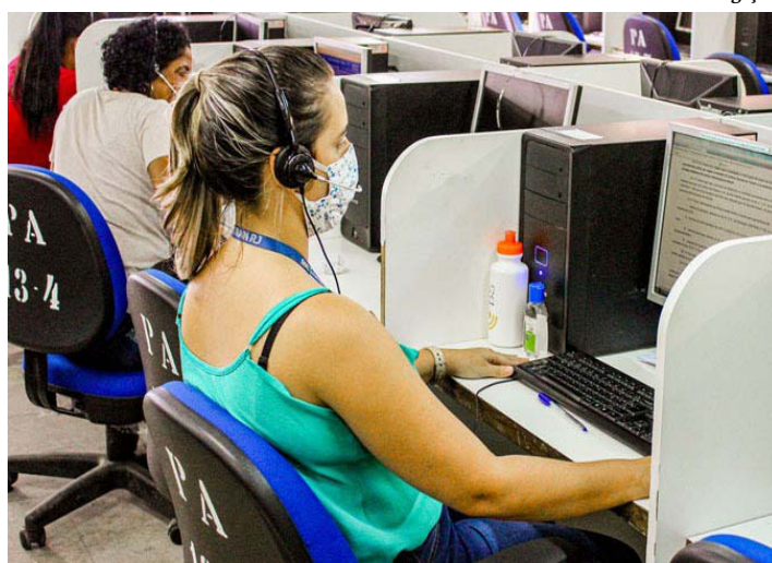
Novo horário traz maior comodidade

O teleatendimento do Detran passou a funcionar de 6h à meia-noite nesta segunda-feira (21). A medida visa facilitar o acesso dos usuários às marcações no departamento fora do horário comercial.