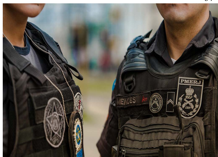
Estudo é inédito no país

Em 2019, 8.423 armas foram retiradas das mãos de criminosos no estado do Rio de Janeiro. No acumulado da década, 82.969 armas de fogo foram apreendidas pelas polícias civil e militar, o que significa, aproximadamente, uma arma a cada hora. Se forem contabilizados os valores médios de comercialização de