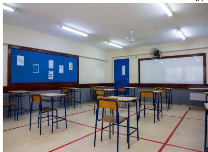
Escolas terão mínimo de 20 mega

A rede estadual de ensino ganhará maior conectividade a partir deste ano. As escolas, que terminaram 2020 com uma média de apenas um mega de velocidade de internet, começarão 2021 com o mínimo de 20, podendo chegar até 100 mega, de acordo com o quantitativo de estudantes matriculados. O salto de conexão, que inclui a disponibilização de wi-fi para alunos, se deve ao novo modelo de contratação de serviços de banda larga, agora feita diretamente pelas escolas, por meio de verbas disponibilizadas pela Secretaria de Estado de Educação (Seeduc). O valor anual do investimento é de R$ 4 milhões. Pág 04