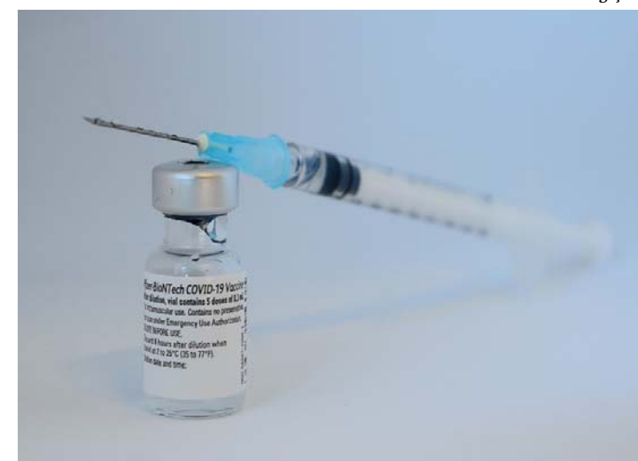
R$19,9 bilhões serão destinados

O presidente Jair Bolsonaro assinou um decreto que reabre crédito extraordinário de R$ 19,9 bilhões para custear vacinação da população contra o covid-19. O crédito de R$ 20 bilhões para esse fim estava previsto em uma Medida Provisória (MP) editada em 17 de dezembro, já no fim do exercício financeiro. Em razão da exiguidade de tempo, explicou o governo, o decreto reabrindo o crédito foi necessário. "O decreto visa a garantia e a disponibilidade de recursos financeiros para ações necessárias à produção de vacina segura e eficaz na imunização da população brasileira contra a Covid-19", disse a Secretaria-Geral da Presidência da República. Pág 04